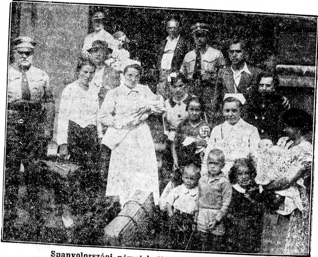
Spanyolországi németek Németországba menekülnek.

Másnap Erzsébet tanácsra hívta a lengyel főurakat és főpapokat. Ezek szívesen vették a a tervet. Előnyt jelentett és gazdagodást. De ifju királynőjüket is sajnálták, tudván nagy vonzódását jegyeséhez. Már-már elejtették a