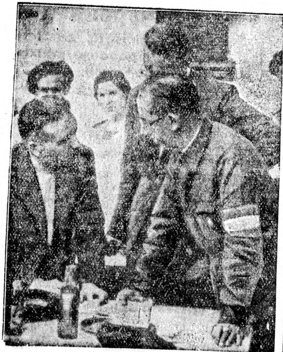
A spanyol forradalom színhelyéről.

Rómából jelentik: A bécsi „Reichspost” itteni tudósítója értesül, hogy a Vatikánhoz naponként tömegesen érkeznek jelentések, amelyek a spanyolországi katolikus lakosság