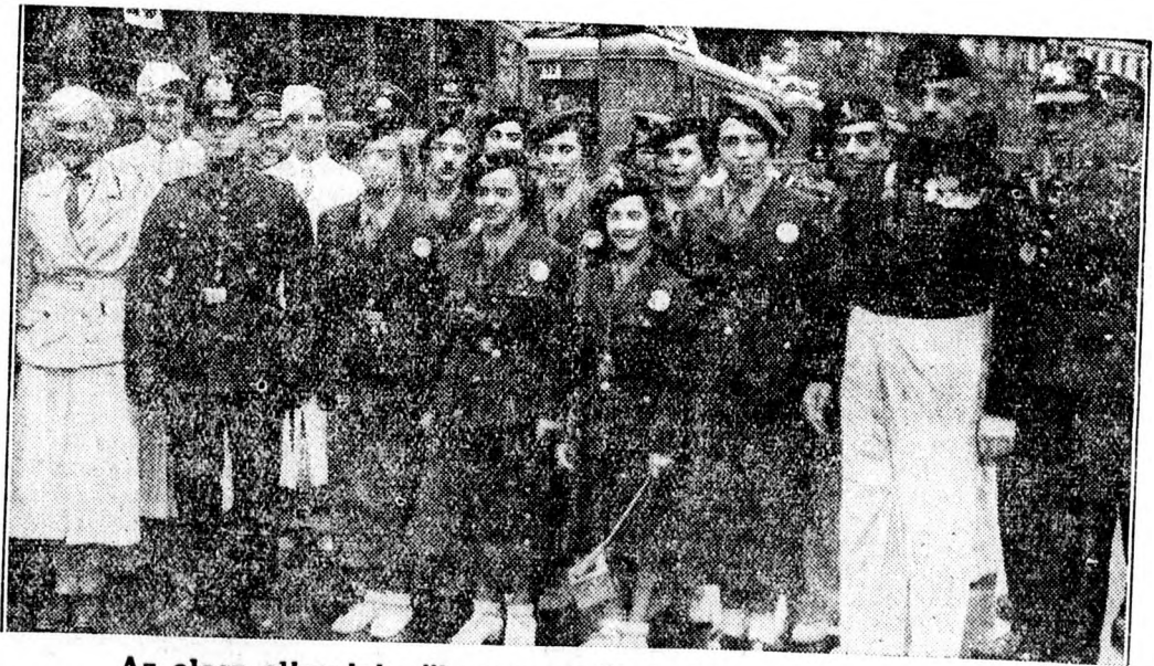
Az olasz olimpiai női versenyzők kedden érkeztek Berlinbe. D. Lewald államtitkár üdvözölte őket a pályaudvaron. Fevételünk közvetlen megérkezésükkor készült róluk.