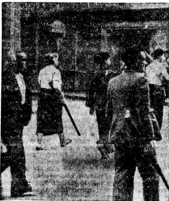
A spanyol forradalom színhelyéről.

Megölt a cséplőgép egy tizenkétéves gyermeket. Satu-Mare. Saját tud. Pénteken délután a satumareli ügyészséghez telefonjelentés érkezett a copalnici csendőrségről, hogy a község határában halálos szerencsétlenség történt. Az üzemből levő cséplőgépnek egy tizenkétéves fiú is dolgozott, aki a cséplőgép dobjába esett, amely halálra sebezte. Az ügyészség rendelkezése az ellen, aki a fiatal gyermeket munkára alkalmazta, szigorú eljárás indul.