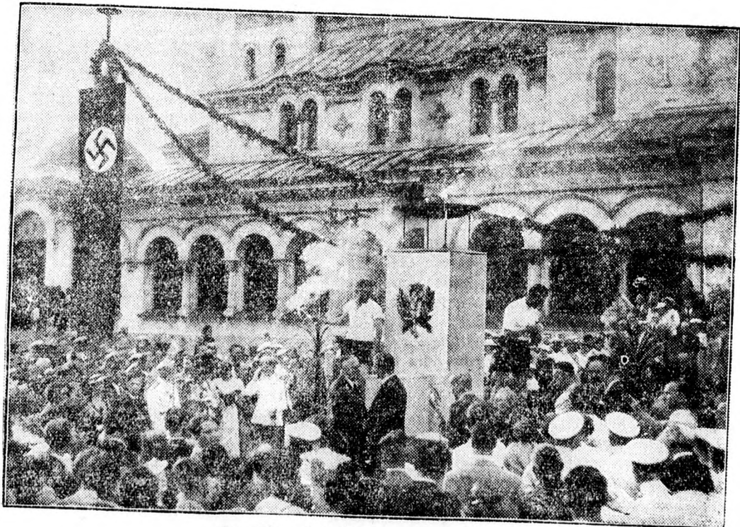
Az olimpiai fátyla Szófiában.

Mert csak az egyedüllétben gondolkozhatik, fejlődhetik az ember. Csak az egyedüllétben tudja felfogni, hogy voltaképpen milyen nagy méltóság, milyen nagy kitüntetés, mekkora feladat embernek lenni.