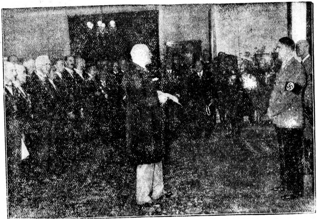
Hitler fogadja az olimpiai komité üdvözlését.

Timisoara. Saját tud. Timisoarán tudvalevőleg a megyei gabonaértékesítési bizottság a maga hatáskörében ideiglenesen megengedte, hogy a pékek a házilag készített és hozzájuk hozott kenyeret a délelőtti folyamán süthetik s erre a kenyérre nem kell kenyérbélyegget ragasztaniok. Most Lugojon a pékek kérelmére a megyei prefektus, a polgármester és a pénzügyi adminisztrátor értekezletet tartott. Kimondták, hogy Lugojon is szabad a pékeknek, egyelőre, a házilag készített kenyeret sütniök. Remélik, hogy az irányítást elterjesztést Bucarestben jóváhagyják, úgyhogy aztán az engedély véglegesnek lesz tekinthető.