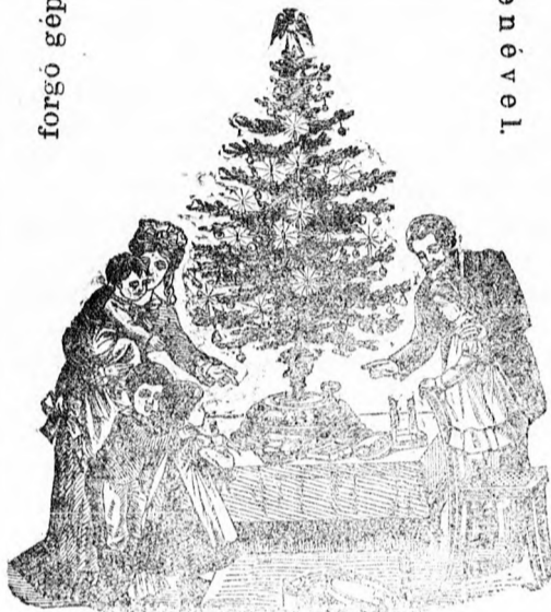
A fent ábrázolt és nickellből készült karácsonyfa-állvány ünnepléses zenekísérettel együtt lassu ütemben forgatja a karácsonyfát és a szent ünnepeket nagyban emeli. Ára 20—55 frt.

Pönn, Marcapan, Anisza, Aniston Sidor, Herophon és más egyéb forgatható és magától játszó családi hangszer zenélő művek, melyeken még az is kinek fogalma sincs a zenéhez eljátszhatja a legkedveltebb és legújabb zenedarabokat, — a legjutányosabb áron kapható.