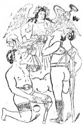
Utánzás ellenvéde 16307