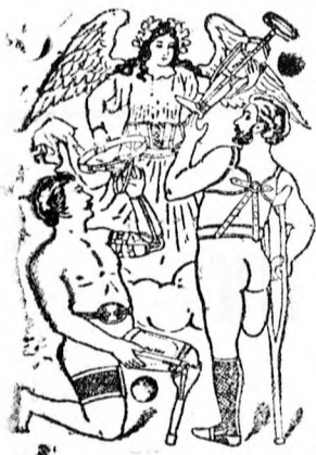
Utánzás elleny édre 16807. A

Ékszer ne vegyen addig, míg Khón szerésznél meg nem nezi, mert fele árban kaphatja az általa zálogházakból árverésen megszerzett ékszereket. — Értekezhatni a debreczeni színházzal szemben levő Erzsébet kávéházban.