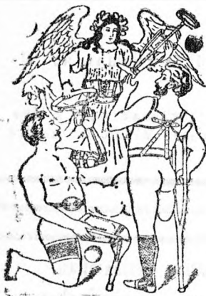
Utas ellenvéde 16567.

stb a legjobb minőségben jutá nyosan beszeresethetők. Nagy kézes árjegyzék ingyen és bérmentve. (Fenn címre ügyelni tessék)