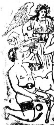
Utánzás ellen védvé