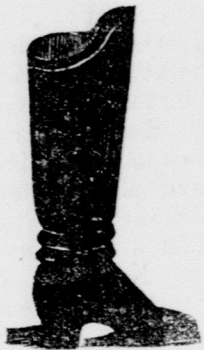
Az arany csizmához.

Köz tudomásra hozom, hogy helyben főpiac Biedermann palotájában Május óta tenálott czipő üzlettel felhagytam és az abban levő egész czipő áruraktárt fő üzletembe