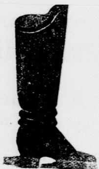
Az arany csizmához.

Köz tudomásra hozom, hogy helyben főpiacz Biedermann palotában Május óta fenállott czipő üzlettel felhagytam és az abban levő egész czipő áru raktárt fő üzletomb.