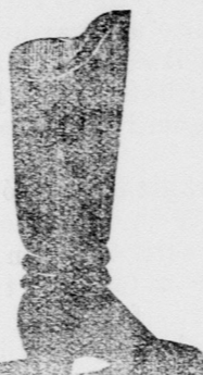
Az arany csizmához.

Közludomásra hozom, hogy helyben főpiacz Biedermann palotá- ban Május óta fenállott cipő üzlettel felhagytam és az abban levő egész cipő áruraktárt fő üzletomb)