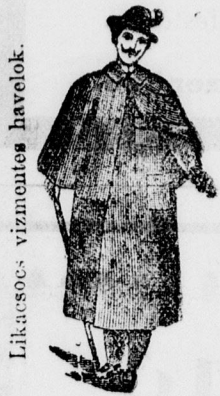
Lilacsos vizmentes havelok.