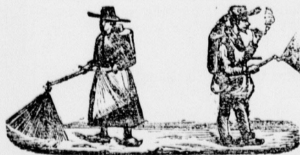
Penészgomba (peronospora) fecskendő.