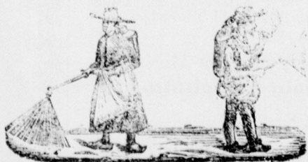
(Penész peronospora) fecskendő.