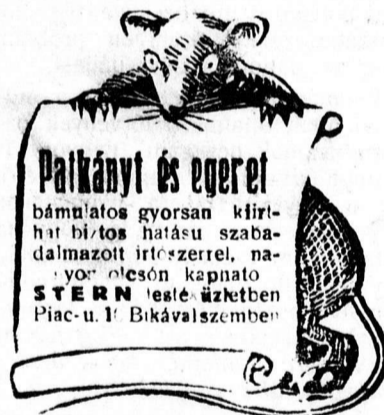
Ingyen utas-mas mindenkinek. Saját érde-ken győződjön meg.

Pompás sportot nyújtott vasárnap Debrecenben a Bocskay és a híres Sabária küzdelme, amely a papir-formák ellenére is teljesen egyenlő-erők küzdelmét mutatta. Az első fél időben, amikor a Sabária 1:0-ra ve-zetett s a Bocskayn némi csüggedt-séget és lankadtságot lehetett észre-venni, úgy látszott, hogy a Sabária tekintélyes gólarányu győzelemmel fog eltávozni. A második félidőben azonban a Bocskay minden erejét összeszedte s lelkesedését s győzni-akarását szembeállítva a Sabária