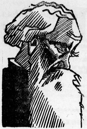
A SZÁZÉVES TOLSZTOJ.