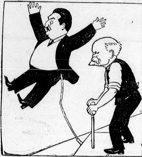
Poincaré kinevezi a légiügyek miniszterévé Eynac Laurent-t. „Charivari”

Potom olcsó árért szüretelő kádak, préssek, darálók eladók. Széchenyi u. 22 5210