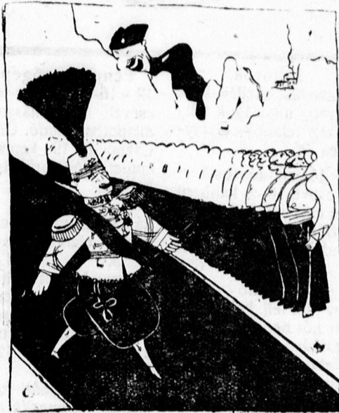
Minél kisebb a hatalom, annál na- gyobb a tollbokréta.

PARENTHESY ingatlanokat értéke- sítő Irodája Piac utca 63. Telefon 5-64.