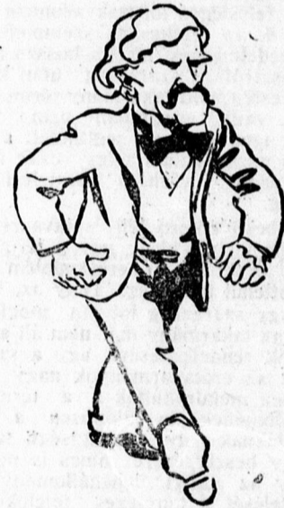
MACDONALD az angol munkáspárt vezére.