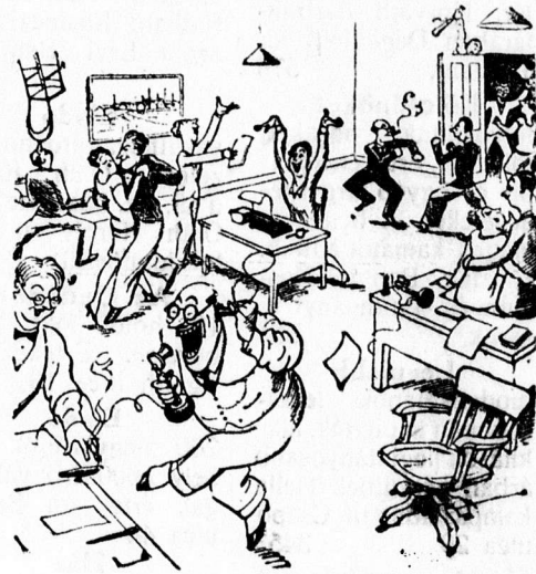
Ha a főnök elutazott.