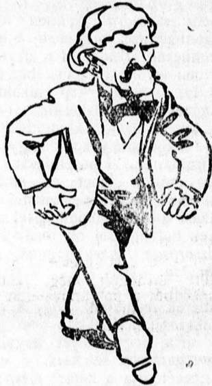
MAC DONALD miniszterelnök

Mac-Donald designált miniszterelnök összes minisztereit a munkáspárt tagjai közül akarja választani.