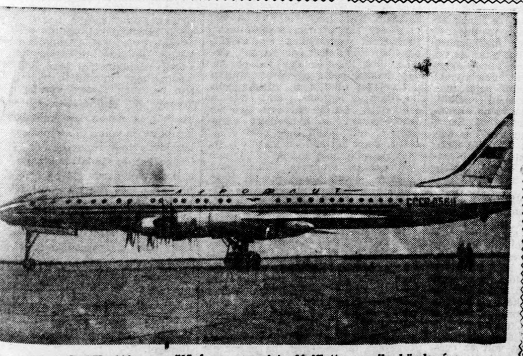
A TU-114-es repülőgép a szovjet légiflotta egyik büszksége

Cape-Canaveral (AP) A Cape-Canaveralban levő kísérleti központban csütörtökön 2 perc és 20 másodperccel a kilövés után felrobbant az Atlas-Interkontinentális ballisztikus lövedék. A légiro a kísérlet kudarcának okát nem közölte.