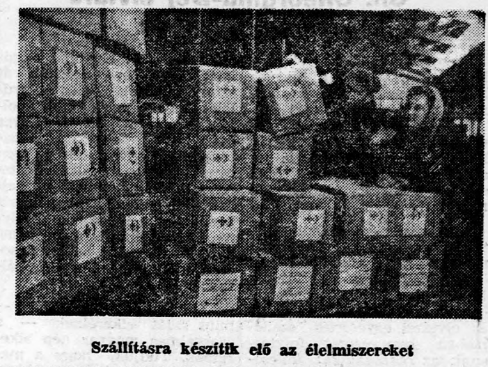
Szállításra készítik elő az élelmiszereket