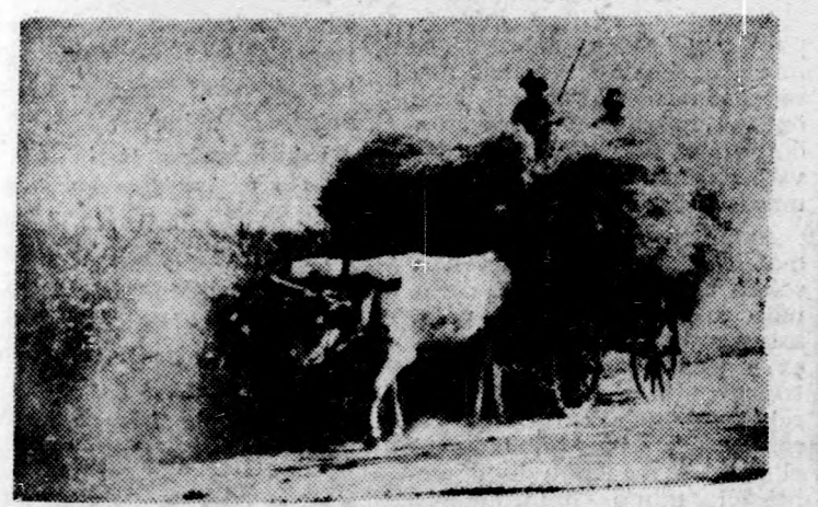
Poros úton megy a szekér, viszik a szérűre learatott gabonát.

gép, kívánja a kényét, etetni kell. Szekerek mennek a faluból, port kever a lovak, tehének lába, asztalra hordják a föld termését. Költők szép verseket szoktak írni a kenyérről, az ételről, az aranyhoz hasonlítják a szákotba pergő búzaszemeket. A nagy munkák, a betakarítás, hordás, cséplés idején, ezekben a mindenképpen forró napokban köszöntjük azokat, akik a tarlókön, asztalok tetején, a cséplőgépek mellett tűző napban, kánikulában járhatóan aratják, cséplik, gyűjtik népkün idej kényeret.