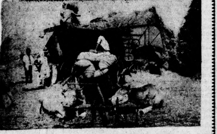
Még egy zsák hiányzik s indulhat a szekér a cséplőgép mellől haza a telt zsákokkal.