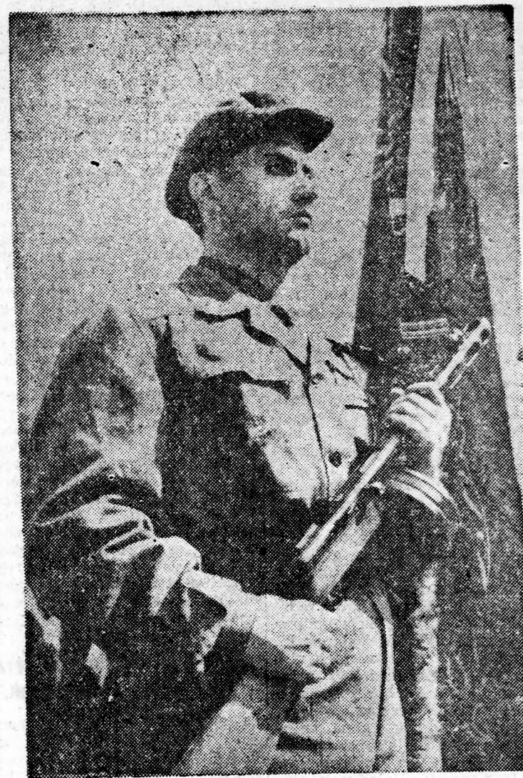
Alkotmányunk ünnepe Berettyóújfaluban és Püspökladányban volt munkásörzsázad névadó ünnepség.

Művelődési otthont avattak Tiszacsegén, népművészeti fotó és amatőr képzőművészeti kiállítás nyit Berettyóújfaluban, társadalmi munkával épített strandot avattak ugyanott — az alkotás, a méltó megemlékezés, a meghitt szórakozás ünnepe volt alkotmányunk napja Hajdú-Biharban.