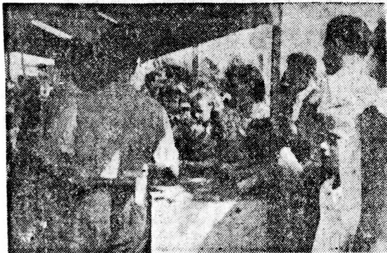
Meleg van, jólesik a hűsítő ital, nagy a forgalom az elárúsító sátraknál.

Augusztus 20-án, forró nyári napon, alkotmányunk ünnepe városokban és falvakban jártunk. Ünneplő ezrekkel találkoztunk: a megye minden lakott helyén megemlékeztek ezen a napon alkotmányunk évfordulójáról. Lehetetlen mindenről beszámolni, hiszen tele volt ez a nap eseményekkel. Dél előtt gyűléseket rendezett a Hazafias Népfőrd, mindenhol méltatták a szónokok a nap jelentőségét, alkotmányunkat. Sok helyen közös ebédet vettek részt a termelőszövetkezetek tagjai — a falu lakói. A délután és az este a játékok, a sport és a szórakozásé volt.