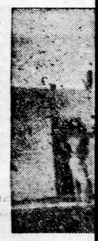
A hatodik órában