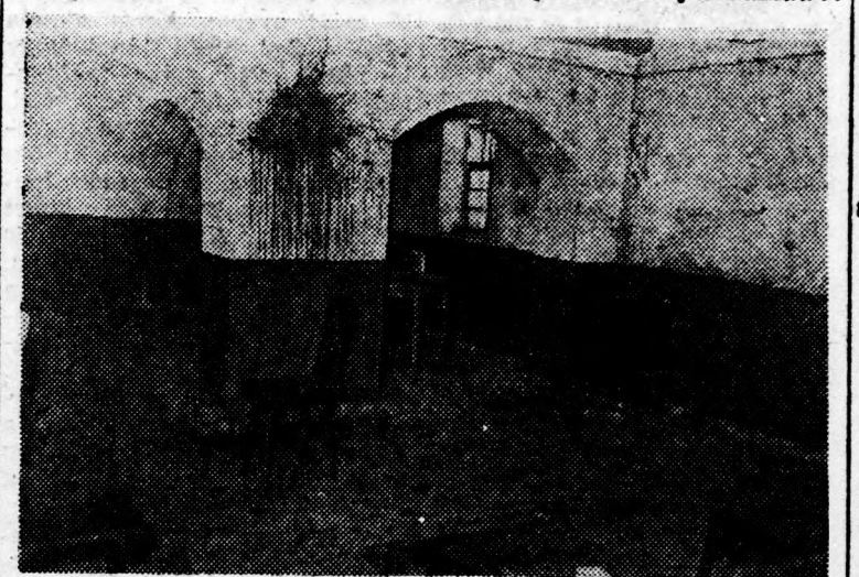
Mit keres a málnaszörp a falon? Erre a verekedés provokálói adnak majd választ a bíróság előtt