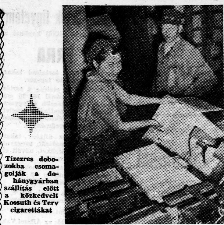
Tízres doboz- zokba csoma- gólják a do- hánygyárban szállítás előtt a közkedvelt Kossuth és Terv cigaretákat

Mikor délen hazafelé lép- delt, már egészen bizonyos volt benne, hogy megveszi. Mielőtt azonban belépett vol- na az ékszerüzlet ajtaján, megállt a kirakat előtt. Látni akarta még egyszer az imá- dott tárgyat. Ott volt. Eppen