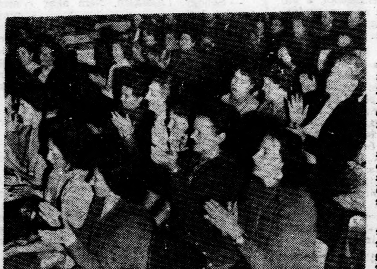
A gyűlés résztvevőinek egy csoportja