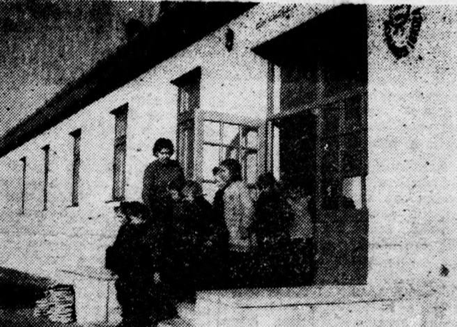
Szép napfényes az idő, menjünk ki gyerekek az udvarra

Pár héttel ezelőtt adták át kedvesebb legyen az iskola rendeltetésének a tégláskerti új iskolát. Nagy szüksége volt erre a kertségnek, mert a régi iskola bizony már kiürült. Ezért büszkeséget kell tanúsítanunk, hogy leküzdjük a jelenlegi nehézségeket és mindent megtegyünk földünk békéjének biztosítására.