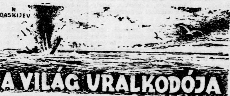
A VILÁG URALKODÓJA

A flotta kapitánya rádión közölte, hogy a hatalmas jéghegy magassága a víz fölött négyszáz méter, víz alatti része pedig kétezer méter.