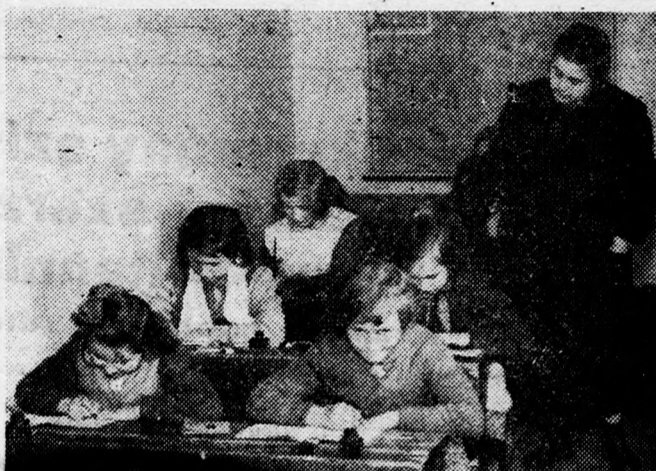
Irás óra a IV. osztályban