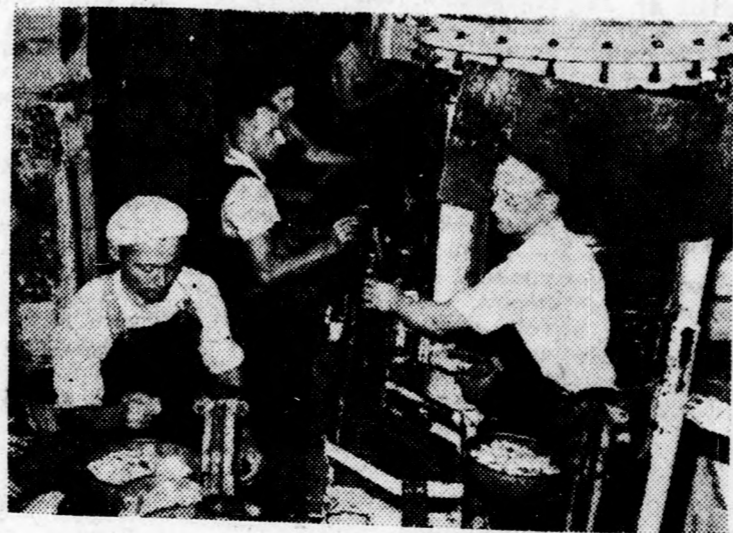
Palackozzák a friss sört.