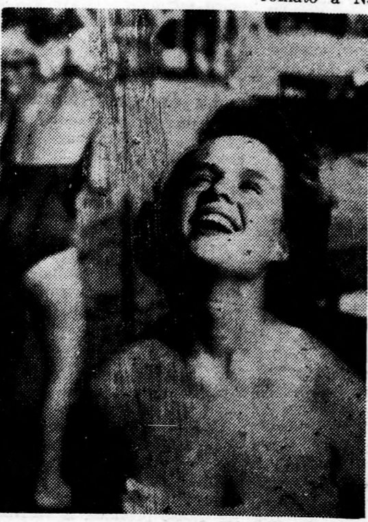
„Jaj de jó a zuhany alatt”

A nagyerdei fürdőben pedig megszületett az idei rekord. Nyolcezer keresték fel vasárnap a festői környezetű, minden kényelmet, pihenést, közönségnek kedveskedett a fürdő vezetősége is: vasárnap szinte majdnem egész nap működött a hullám gyermekek, felnőttek öröme. Hétköznapokon délelőtt, délután is van forgalom. Különösen úgy 5 óra tájban, amikor sok dolgozó kimegy, hogy „lemossa” az egész napi fáradtságát.