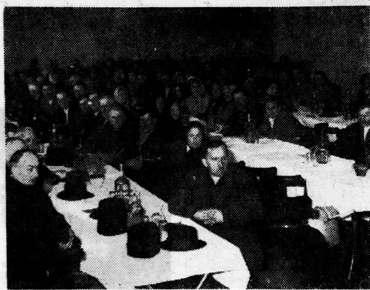
A hajdúszoboszlói földművesszövetkezeti küldöttgyűlés résztvevői figyelmesen hallgatják a vezetőség beszámolóját.