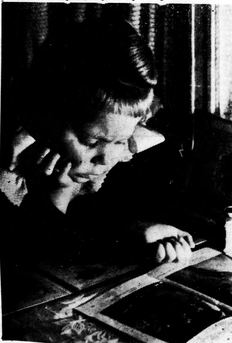
Képeskönyv előtt Beküldte: Farkas József, Debrecen.