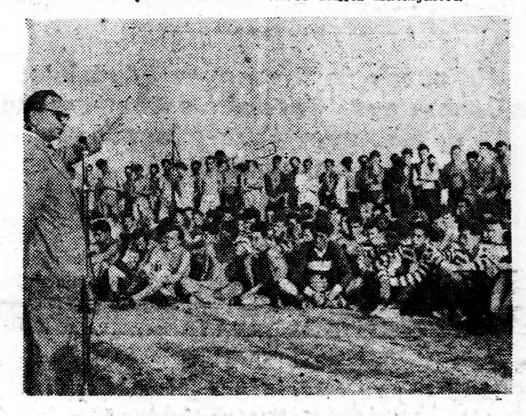
Rögtönzött röpgyűlés az alakuló téren