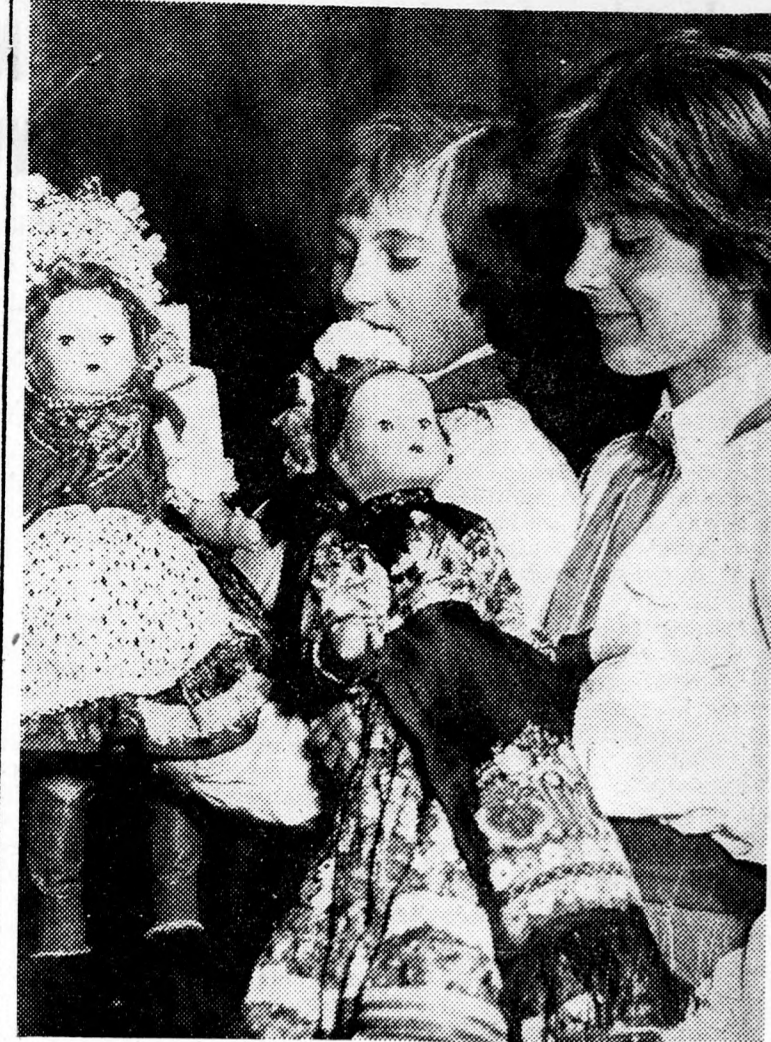
A debreceni úttörőház kézimunka szakkörének tagjai lelkesen készülnek az úttörőmozgalom 15. évfordulójának megünneplésére. A Budapesten megrendezésre kerülő kiállításra sok szép népviseletbe öltöztetett babát készítettek el.

Hajdúsámsónban, amióta az átszervezés megindult, 1076 család lépett be a korábban is működő termelőszövetkezetbe: a Dózsa és a Kossuthba. Új szövetkezet nem alakult, mindenki a régiéket valamelyikét választotta. A Dózsa 492 családdal erősödött, a határa pedig 2689 holddal lett nagyobb, a Kossuthba ugyanakkor 584 családot iratkozott be, 2893 hold földdel. Az előbbi szövetkezet kedden már közgyűlést tartott, melyen felvették az