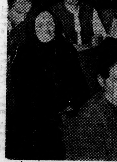
Az ankét hallgatósága

évek során a megye termelőszövetkezeteinek önköltségét kedvezőtlenül befolyásolta az a tényező, hogy a felnevelt csibére nagyon sok a munkaráfordítás. Nem egy esetben két, sőt három gondozó nevel 1070-1500 baromfit. Ezzel szemben a jól szervezett telepeken 8-10 000 baromfi is juthat egy gondozóra. Sok hiba mutatkozik a felnevelési veszteségek terén is. Megyei viszonylatban termelőszövetkezeteink mintegy 15-20 százalékos veszteséggel