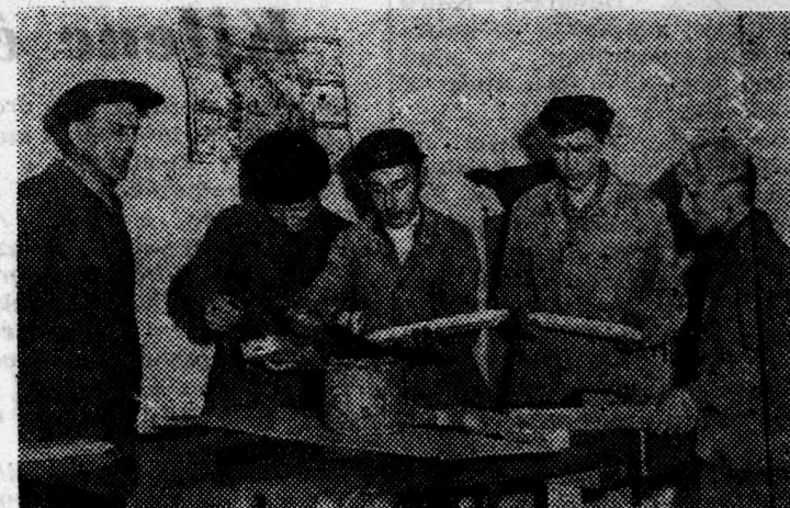
Az enyvezés „fortélyait” is elsajátítják a fiatalok