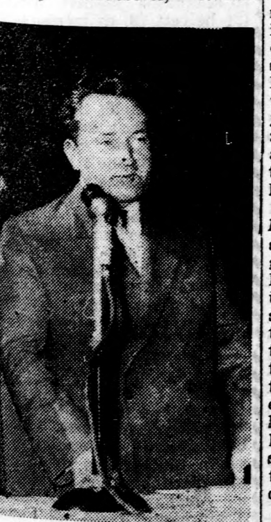
Az ünnepségen felszólalt Krasztju Stojcssev, Bulgária magyarországi nagykövete.

Bolgár testvéreink elküldték hozzánk szellemi termésként javát. Ezért mi nagyon hála- és köszönetünket fejezzük ki — mondotta —, majd a bolgár költészetéről és a bolgár kulturális és tudományos élet néhány kérdéséről, többek