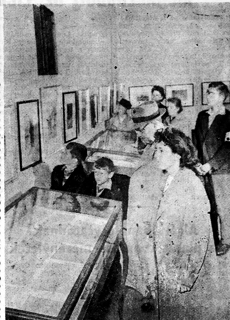
Nagy érdeklődés Kiséri Bakoss Tibor festőművész kiállítását, melyet a debreceni Déri Múzeumban rendeztek meg. Képünk a kiállítás gazdag anyagának egyik részét mutatja.

Az atomfegyver-kísérletek felfüggesztésének időtartamáról és az ellenőrző állomásokról szólva Carapkin megjegyezte, az ideigő új angol-amerikai javaslatok elemzése nem jogosít fel olyan megállapításra, hogy ezekben a kérdésekben a nyugati hatalmak valóban változtattak volna álláspontjukon és valamennyire is közelebb kerültek volna a Szovjetunó álláspontjához.