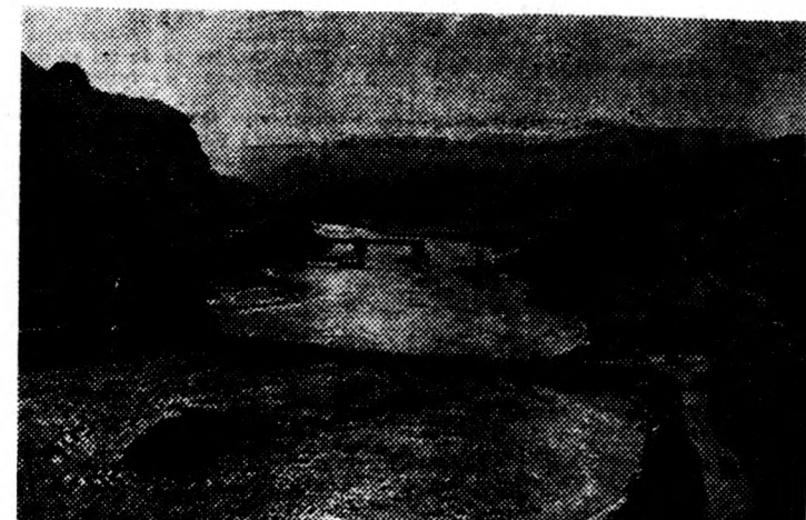
Elterelnek medréből egy folyót Kinában.

szempontból megfelel: a Volga vízhozamát a Pecsora folyó vízzel növelik anélkül, hogy ez utóbbi folyó vízösszegének csökkenésével veszélyeztetné az északi körzetek éghajlati viszonyait. S mi több, a jövőben folytatódóan meg lehet valósítani Davidov ismételt tervét is az Ob és Jenyiszej folyásának megfordítására. Így kiegészítenék a Kaspitenger vízkészleteit a vízzel láttnak el a száraz déli vidékeket. Egy másik tervezet a Baltitengernek az Északi-tengertől való elválasztását javasolja