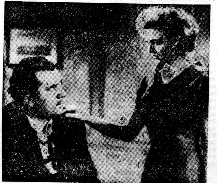
Megmérgezte a családom