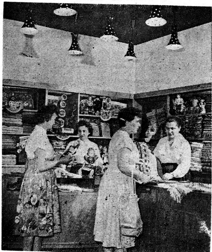
Ismét megkezdte az árusítást a debreceni Népművészeti Bolt

A Népművészeti és Házipari Szövetkezeti Vállalat boltjai országsszerte árusítják a szövő, fazekas és faragó népművészeink által készített alkotásokat. A népművészeti bútork, szőnyegek, dísz tárgyak és ruhaneműk amellet, hogy esztétikusok s a lakás díszítésében mind nagyobb szerepet játszanak, izlésnemesítő funkciót is betöltenek. A vásárlók szívesen keresik fel ezeket az üzlethelységeket, ahol a Népművészeti Tanács által zsűrizett alkotásokban válogathatnak.