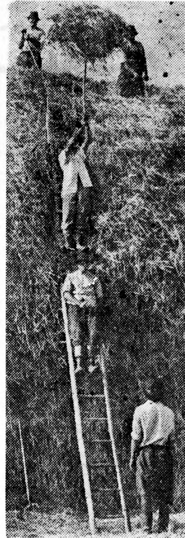
A püspökladányi Lenin Termelőszövetkezetnek ehhez a kazlához még nem jutott gép. Kézről kézzel vándorol a villaszalma, míg feljut a kazal tetejére, hogy télen szárazon kerüljön a jószágok alá, alomnak...

Minden dicséret mégis az emberé, a szorgoskodóké.