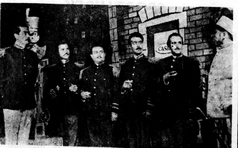
A Nebáncsvirág egyik jelenete