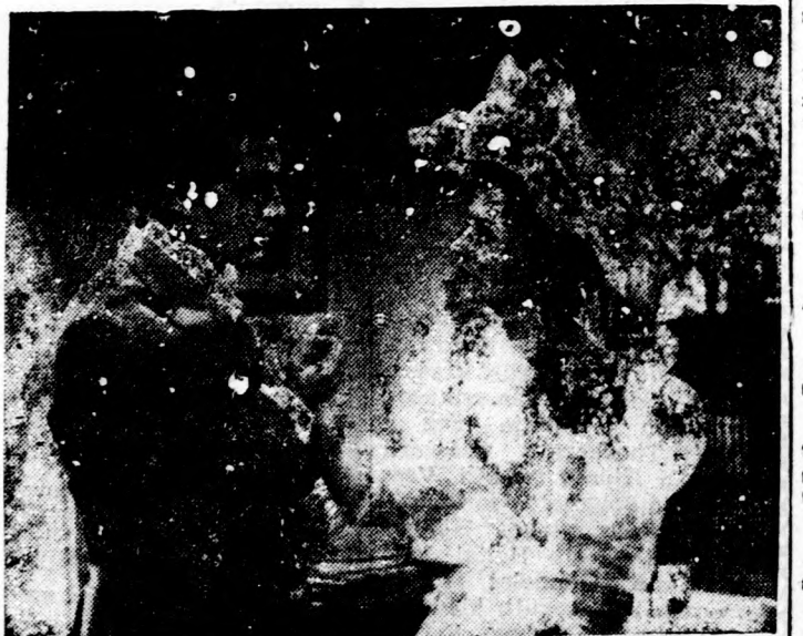
Jelenet Az énekesnő hazatér című filmből

Az Apolló mozi tűzte műsorára az Afrikai képeskönyv című színes amerikai filmet, amelyet James Algar rendezett. Három év fáradságos munkájával készült ez a film, amely a dzsungel és szavannák vadállatainak életét mutatja be. Az Afrikai képeskönyv Walt Disney produkciója, aki az utóbbi években a világ legkülönbözőbb részein forgatott természetfilmeket.