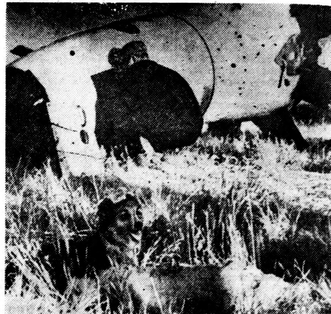
A rakéta tudományos műszerekkel és kísérleti állatokkal pontosan célba érkezett

A szellemi élet nagy kibontakozásának idejét éljük. A szocializmus századában határtalan távlatok nyílnak, új tudományok születnek. Másrészt megindult a munka a nagy összesség, a tudományok szintézise felé. Erre mutat egyrészt a szovjet tudósok eredményeiben egyre újabb területeket érintő, nagy összefoglaló tudomány, az általunk a közelmúltban ismertett homológia, mely átfog egész sereg tudományos területet a jövő kutatásáról — a futurologiáról — az új módszerű karakterológián — a lehetőségkutatáson, életvizsgálaton — át egészen a kozmosz felderítésének módszeres alaptudományát jelentő lunológiáig. Másrészt a tudománytörténet egészét feltáró olyan hatalmas összességek, mint a most készülő Nemes prof. Nagy Tudománytára. Ennek a munkának alapján villantunk rá néhány tudományos kérdésre az alábbiakban.