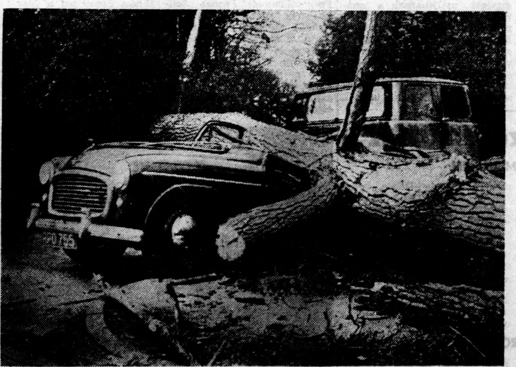
Az angliai Lanarkshire-ben a szél elérte az óránkénti 123 mérföldnyi sebességet. A képen: a szélvihar által kidöntött hatalmas fa rázuhant egy teherautóra Claygate-ban. A sofőr szerencsére megmenekült.