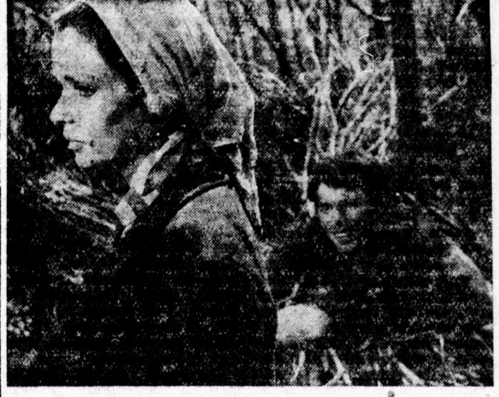
Jelenet a Kápo című filmből