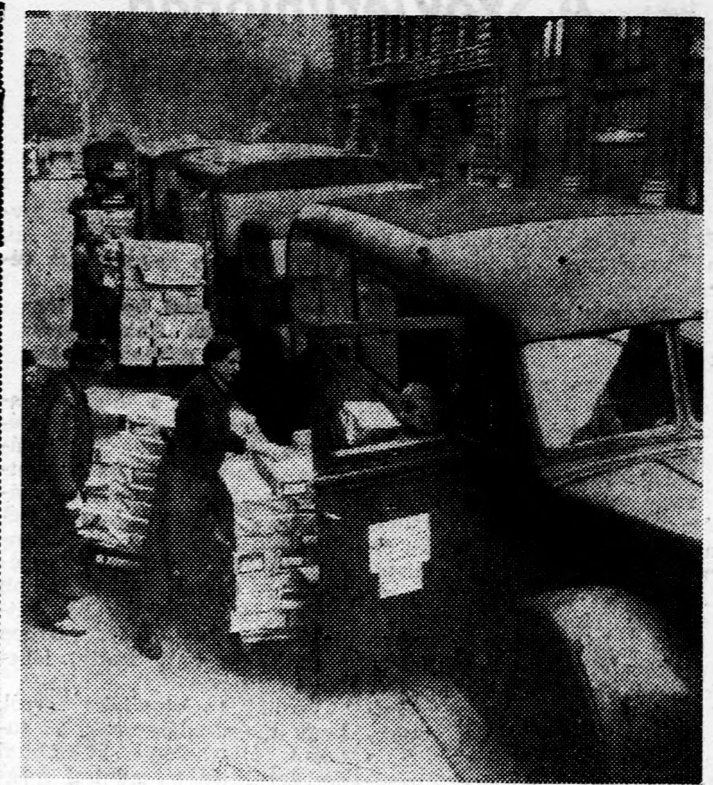
Az Állami Könyvtérjesztő Vállalat Honvéd és Vécsei utcai raktáraiból csaknem másfélmillió könyvet szállítanak az üzletekbe a május 27-i könyvnapra. A képen: teherautókkal szállítják a könyveket a budapesti boltokba

képzés megszerzésének egységes rendezésére benyújtott előterjesztését, majd a közlekedés- és postaügyi miniszter előterjesztésére határozatot hozott a központosított fuvarozás bevezetésére és kiterjesztésére. A művelődésügyi miniszter előterjesztése alapján a Minisztertanács határozatot hozott a „kiváló tanár”, „kiváló tanító” és „kiváló övönő” kitüntető címek ez évi adományozásáról. A Minisztertanács ezután folyó ügyeket tárgyalta. (MTI)