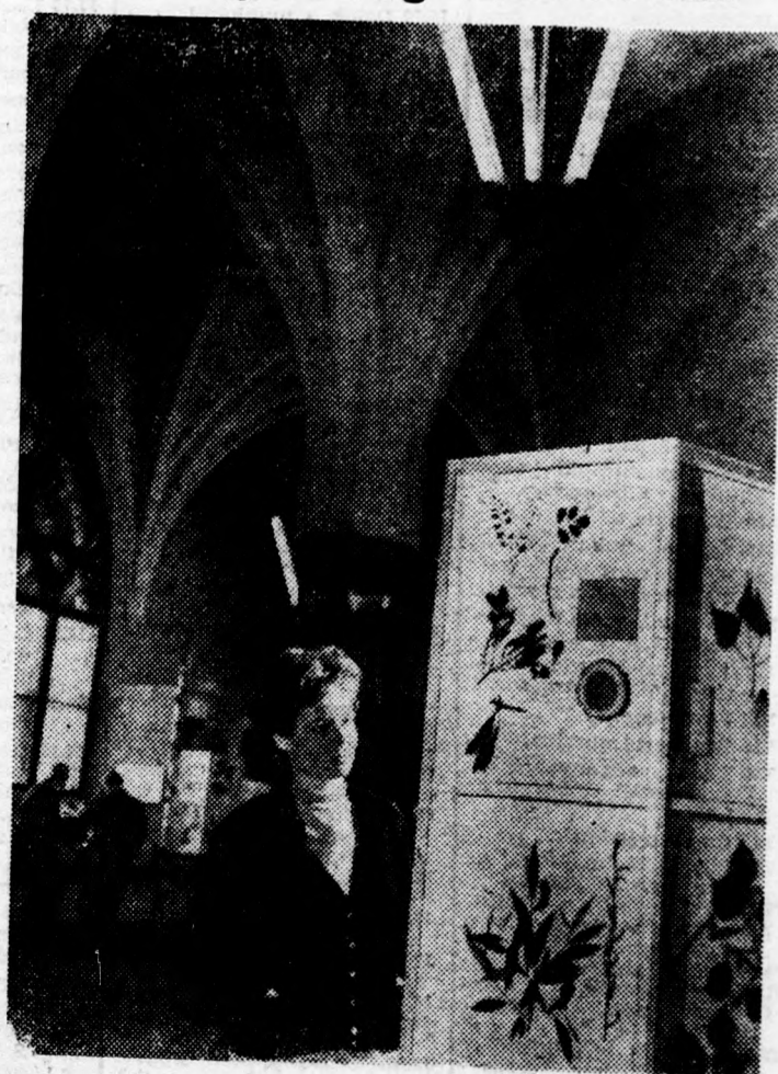
A Mezőgazdasági Múzeum vajdahunyadvári gótikus termében állandó erdészeti kiállítást rendeztek be. Az új kiállítás bemutatja a magyar erdők és az erdőgazdálkodás fejlődését az őskortól napjainkig. A közönség számára az új épített termeket május 15-én, kedden 10 órakor nyitották meg. A képen: Részlet a kiállításról