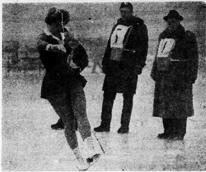
Sjoukje Dijkstra (Hollandia)

Szombaton este a Kisstadionban fináléjához érkezett a műkorcsolyázó és jégtánc Európa-bajnokság. Az utolsó esemény a nők szabadonválasztott gyakorlatanyagának bemutatása volt. A közönség ezúttal is szép számban foglalt helyet a lelátókon és