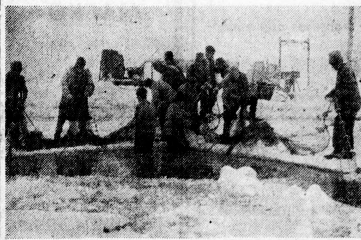
A Szegedi Tőgazdaságban a legkeményebb hidegekben sem szünetel a halászat. Kiemelik a hálót, néhányan a jeges vízben állva dolgoznak.