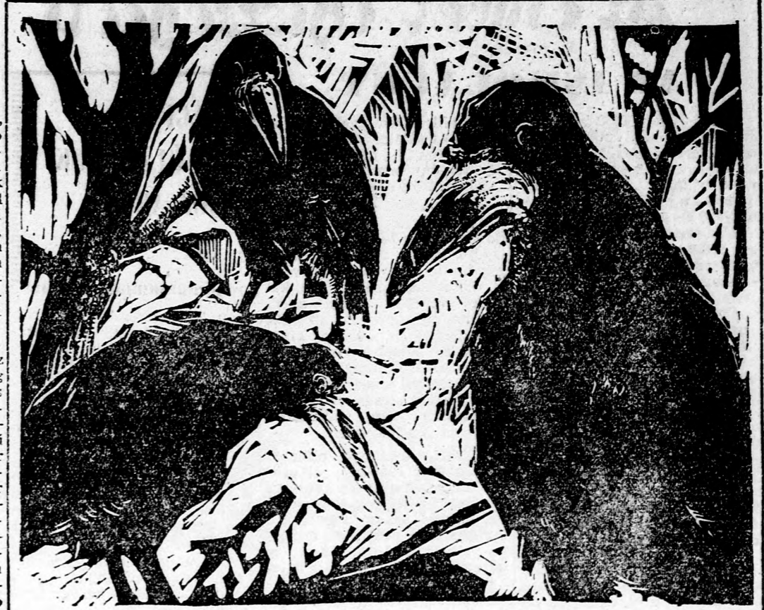
Móré Mihály: VARJAK (Linómetszet)

Messzeemenően nem tudunk egyértelműen a narrátorok beállításával. Több okból. Először is a darab eredeti szövege szerint itt kórus játszik. Budapestre a kórus három férfi személyesítette meg. Ez nyilván hatásosabb volt, mert aláhúzza a történetben szereplő emberek keménységét, határozottságát. Ebben az előadásban a narrátorok nem előremutatók, hanem csak megakasztották. A rendező