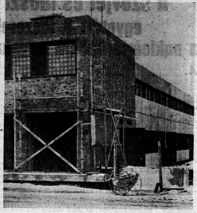
Épül Debrecenben az új orvosi-műszer-gyár. A képen a tetőalát került „melegszerelde” látható, ahol a munka ez év nyarán megindul

Az ország többi vízügyi igazgatóságának körzetében nincs közvetlen veszély, de folytatják az előkészületeket, hogy ne érhesse őket váratlanul a gyors olvadás. (MTI)