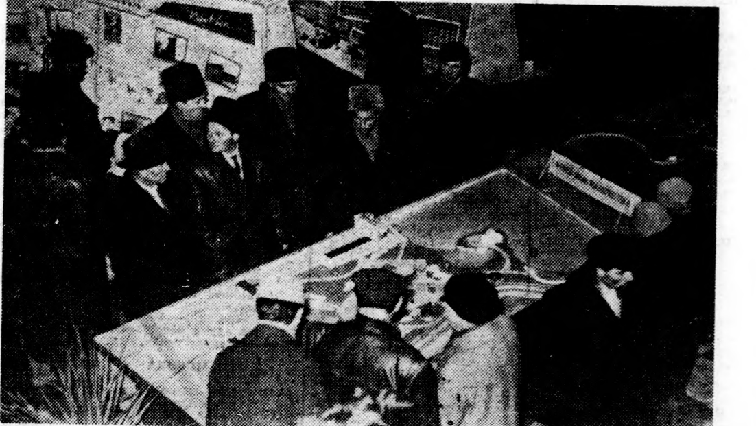
Látogatók a gyógyfürdő makkettje körül

gépállomástól kapott gépekkel szőrzák a nitrogén műtrágyát a gabonavetésre. A tsz két öntözőszivattyút készletbe helyezték arra az esetre, ha az árvízveszély fenyegetné a környéket. A szövetkezet halállományja jól telel, a jégreget alatt nem okozott vést a tél hidege. Ebben az évben már jelentősen segíti a halgazdálkodást a tavaly létesített ivatótó, valamint a 45 holdas előnevelő. A szövetkezet rendelkezik a szükséges halivédőszerekkel, sőt 30 mászát átadnak a Vízügyi Igazgatóságnak.