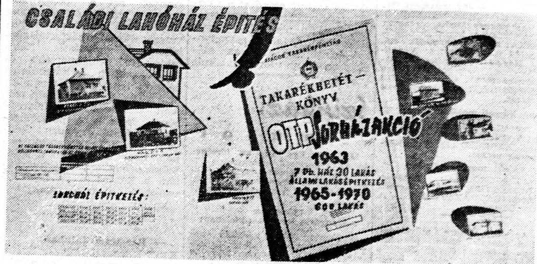
A családi lakóházépítések fejlődését dokumentáló tablómásait, a kibontakozó távlatokat.

Evről évre egyre több lakóház épül a városban. 1959-ben OTP-hitelakcióban és magánforrásból 30 lakás épült, tavaly pedig 83. Ot év alatt 264 lakást építettek. Ez évben 7 állami lakóházat építenek, 1970-ig pedig 600 lakást. Talán az egyik legjelentősebb közsegfejlesztési esemény ezekben az években a városban a vízvezetékhalozat kiépítése, a csatornázási munkák folytatása. Népgazdasági beruházásokból ez évben befejezik a városi főgyűjtő csatornahálózát építését, és a vízműtől a fővezetékét a