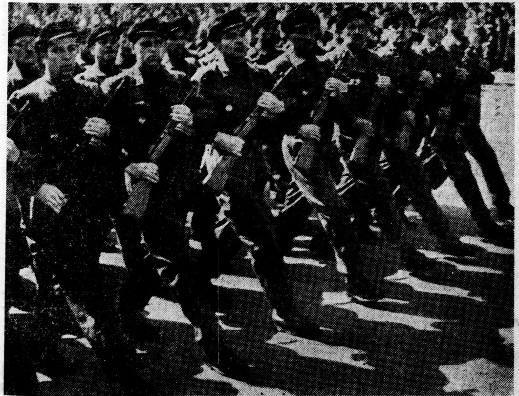
Menetelnek a munkásörök

A díszemelvényen felsorakoztak a kitűnően sikerült parádán részt vett díszegységek parancsnokai, akiknek Dobi István, Kádár János és Czinege Lajos gratulált, egységeik kiváló teljesítményéhez. Elismeréssel köszöntötte a díszegységek parancsnokait M. Thorez is. (MTI)