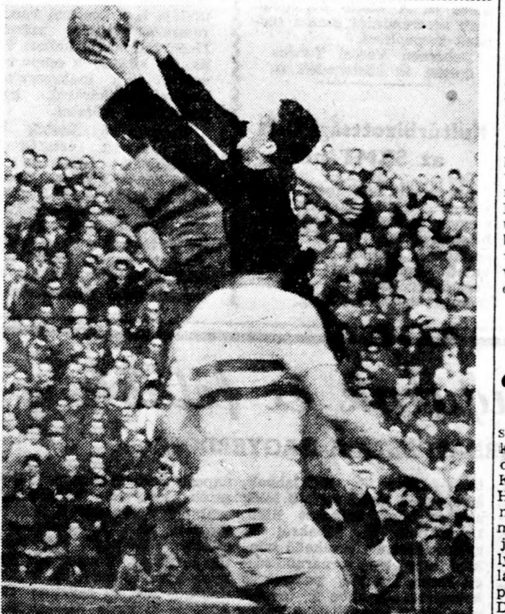
Landi véd