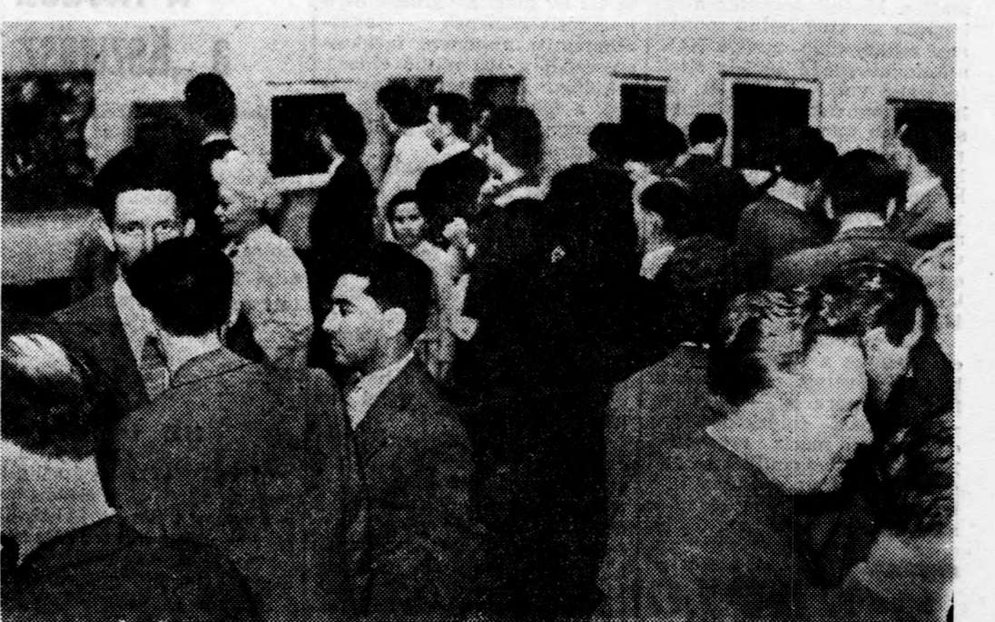
Látogatók a tárlat első napján