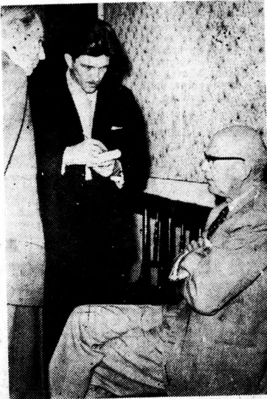
Urho Kaleva Kekkonen, a Finn Köztársaság elnöke nyilatkozik lapunk munkatársának