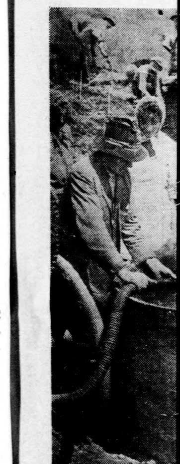
Jókedvűen hordják a