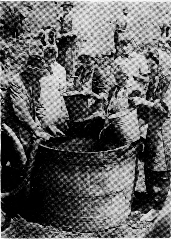
Jókedvűen hordják a vizet a lányok és az asszonyok