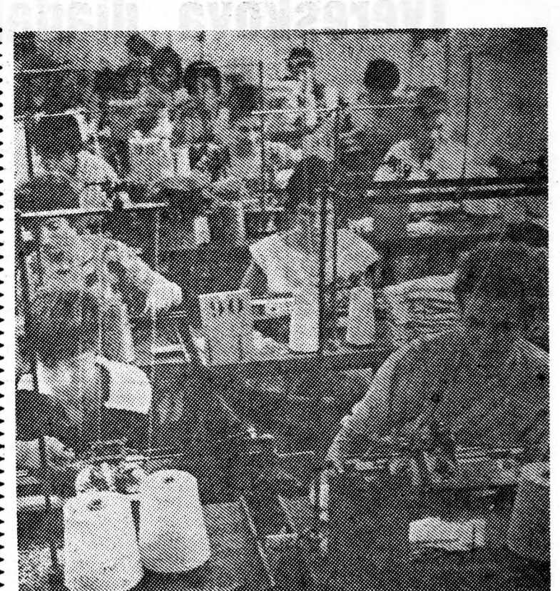
Évente 160 ezer pár kesztyűt készítenek a Debreceni Kötésző Vállalat III-as üzemében. Az elmúlt napokban kezdtek meg az Angliának készülő új fazonú kesztyűk gyártását. Képvonlat a kötőde munkásai láthatók

Augusztus 20-án délelőtt 10 órai kezdettel került sor Vértesen az új filmszínház átadási ünnepségére. A 255 személyes filmszínház egymillióháromszázötvenezer forint költséggel épült. A községi tanács szervezésével a község lakossága 50 ezer forintos társadalmi munkával járult hozzá az építkezéshez. A moziüzemi vállalat 550 ezer forint értékben járult hozzá az építkezéshez, emny értékű gépi berendezést, székelt és függönyt biztosított a vértesi mozi működéséhez.