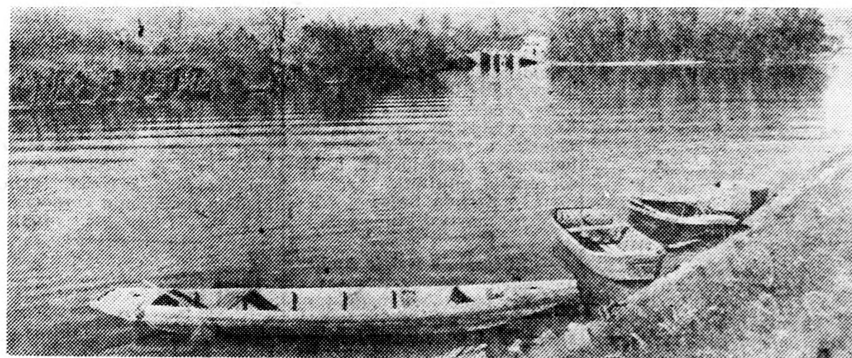
A tasi zsilip

Hazánk vizei bővelkednek jó horgász-lehetőségekben. A fotóriporter képeivel elkalauzol néhány horgásztanyára.