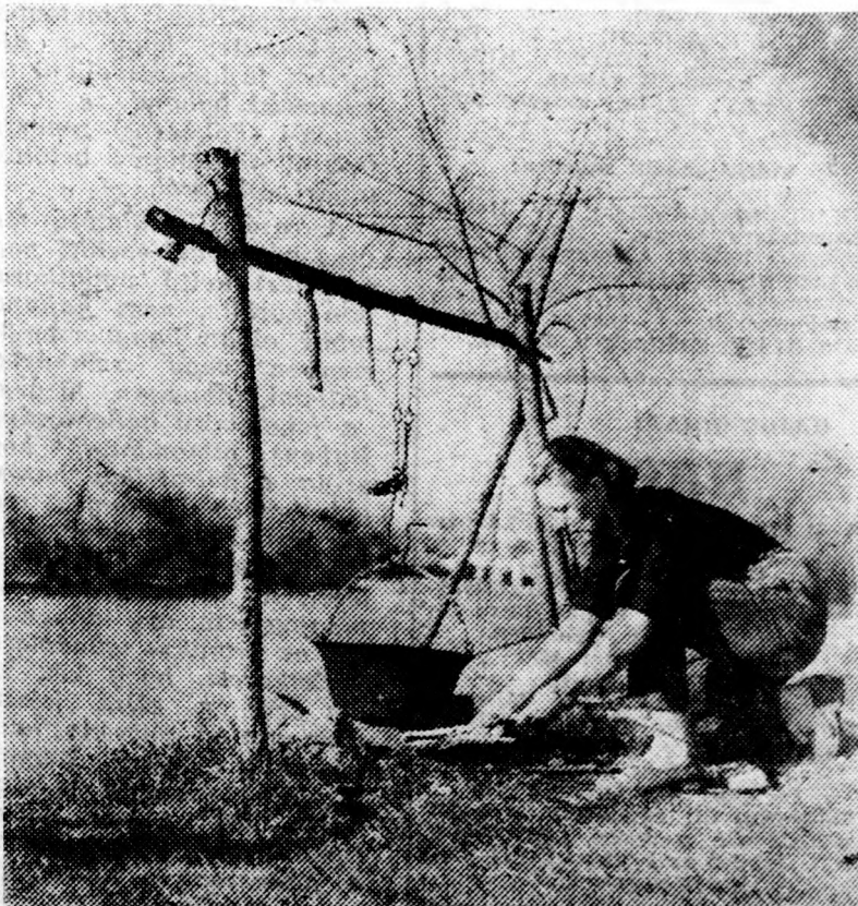
Készül a horgászebéd