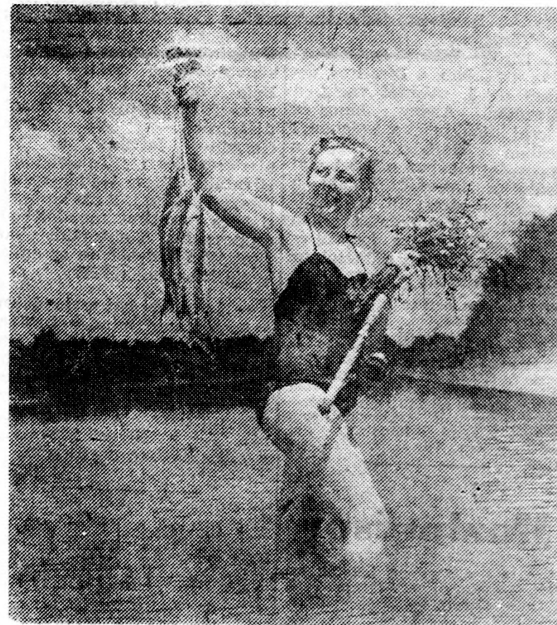
Horgászat a Tiszán