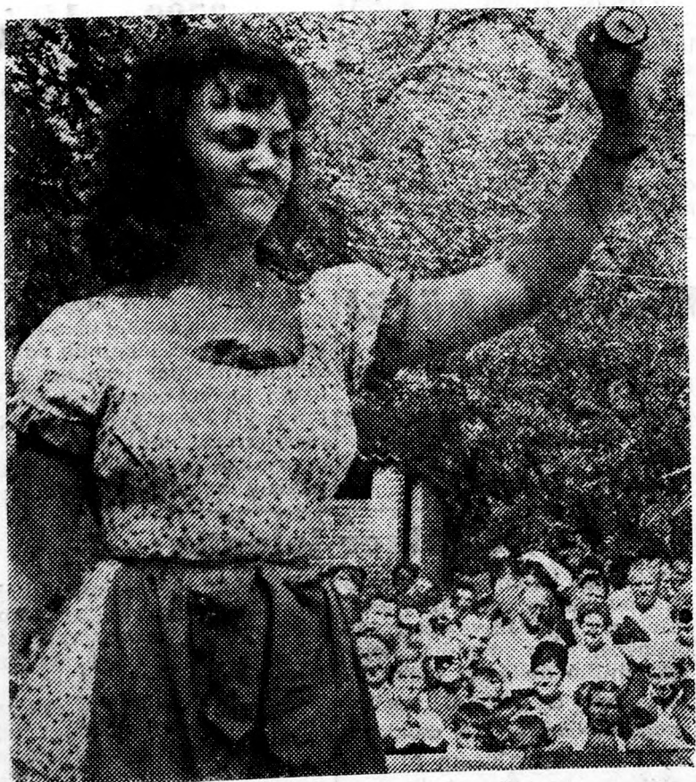
Másodszor fordul a szeren csekerék

A szocialista mezőgazdasági nagyüzemek kialakulásával a falvakban is napirendre került az ügyvitel korszerűsítése. Arra természetesen még sokáig nem lesz mód, hogy a több ezer termelőszövetkezetet drága könyvelőgépekkel szereljék fel, egy-egy ötlettel, jobb szervezéssel azonban most is előre lehet jutni. A Szervezési és Ügyvitel-gépesi-