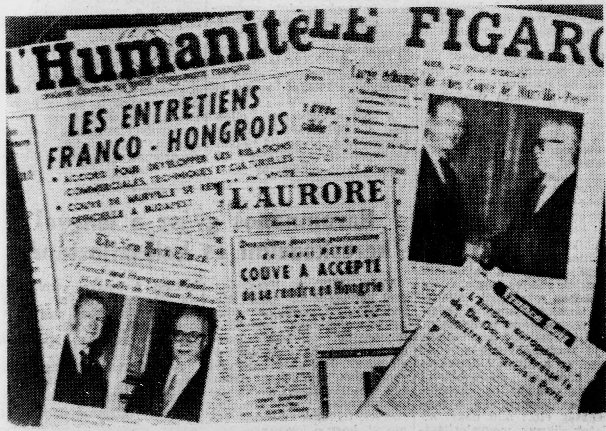
A francia lapok cikkeiben és képeiben számolnak be Péter János magyar külügyminiszter franciaországi látogatásáról

Az együttes határozat megállapítja: a termelési tanácskozások és a munkaértekezletek (a hivatalokban és az intézményekben a tennivalók