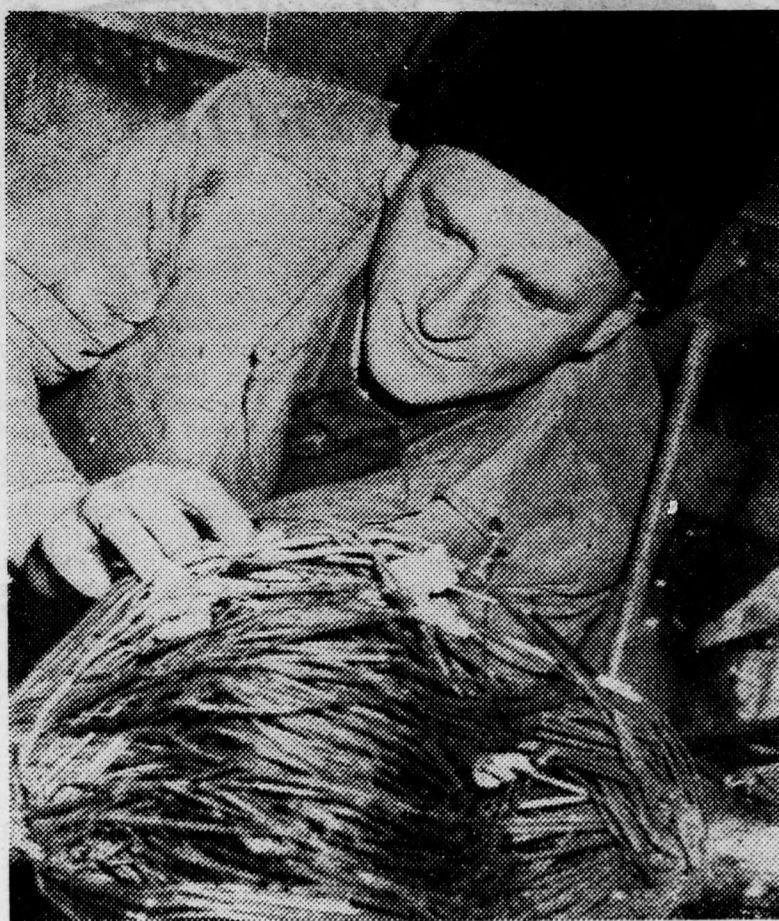
Ezt látjuk a sátor alatt: a szerelő a hiba elhárításán fáradozik