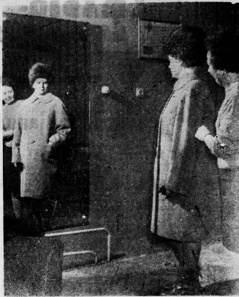
A Debreceni Minőségi Szabó Ktsz Vörös Hadsereg úti női szalonjában havonta 60-70 különböző ruha- és kabátmodell készül megrendelésre. Kepeinken egy-egy szépen sikerült darabot mutatunk be. Angol szabású teveszőr lélikabát, halvány lila színben