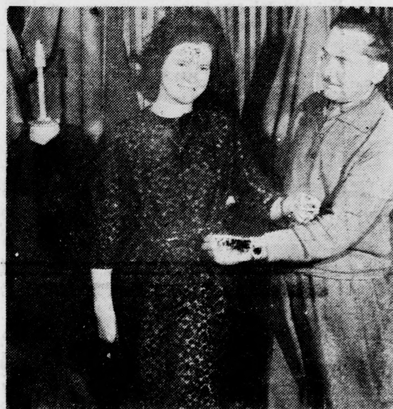
Kisestélyi ruha sötétbordó brokát anyagból, francia szabással