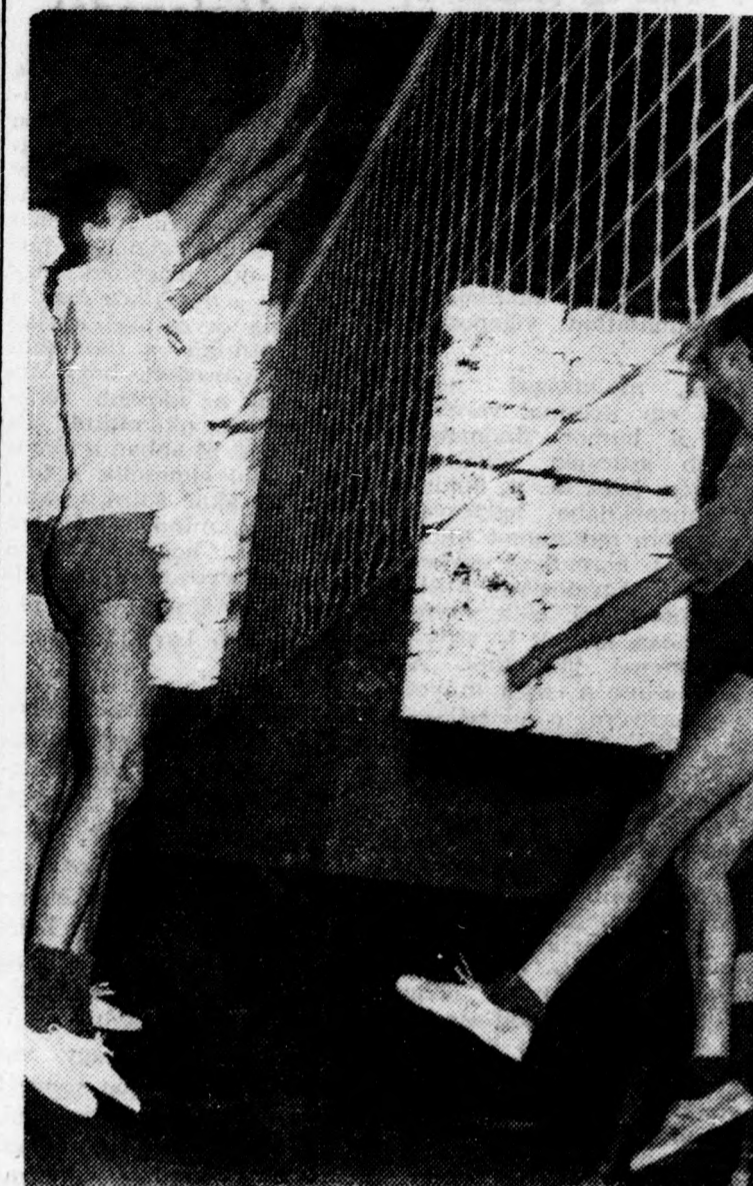
A hálónál — a DASE (fehér mezben) és a DEAC játékosai

Debrecenben, a DVSC sportcsarnokában bonyolították le a DEAC—DASE férfi főiskolai röplabda selejtező mérkőzést. A találkozót nagy izgalom előzte meg, hiszen a két csapat összecsapása az elmúlt főiskolai bajnokságok során is kiemelkedő eseménynek számított. A mostani találkozó nem