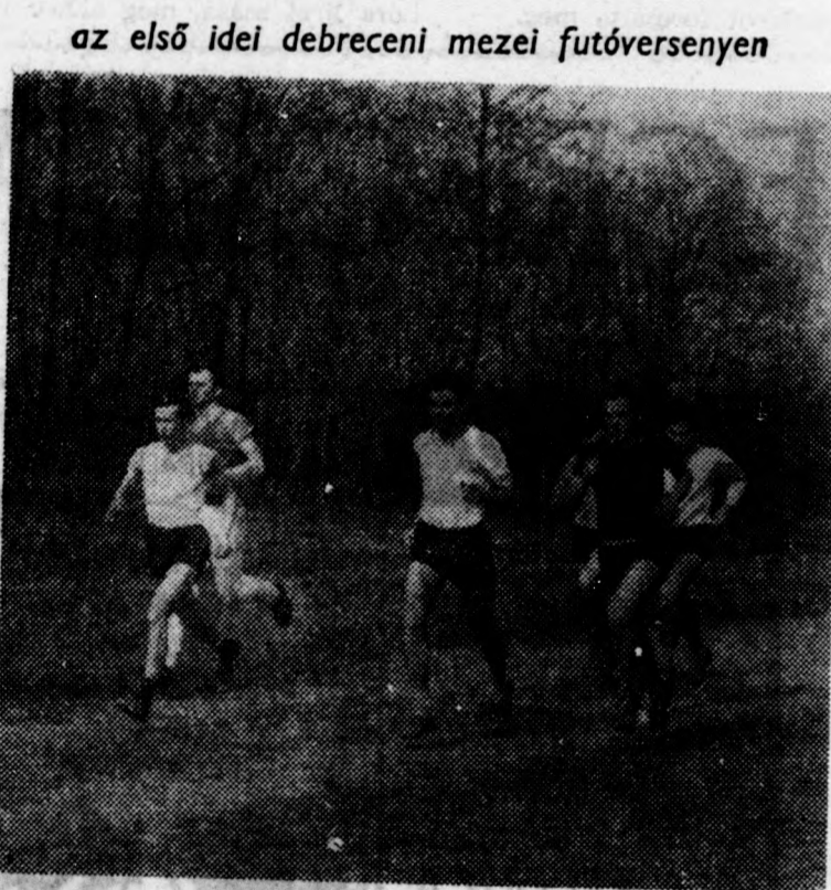
A Nagyerdő útján. A mezelfutók egyik csoportja

A DVSC atlétikai szakosztályának rendezésében vasárnap délelőtti mezei futóversenyt bonyolítottak le a nagyerdei stadion megőtti erdő részben. A versenyen több számban nem volt induló, összesen 18 férfi és két női indulója volt a küzdelmeknek.