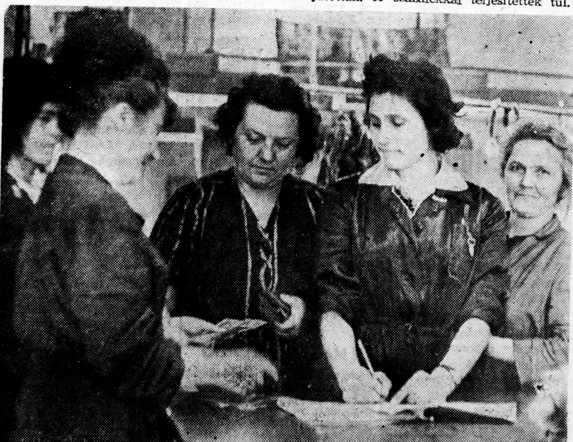
Örömmel veszik át a nyereségrészesedést a ruhagyári dolgozók

gyár exportkiszállítási tervét az elmult évben 101,6 százalékkal teljesítették s egyedül ez átlagosan hat napi fizetésnek megfelelő összeggel emelte a nyereségrészesedés nagyságát, amely így összesen elérte a 2 millió forintot. A jó munka bizonyította, a nyereségrészesedési alap képzésének hatékony eszköz volt az elmult évben, hogy belkereskedelmi termelési tervüket 3,8 százalékkal, a jövővelmezőségi tervet 3,2 százalékkal teljesítették túl.