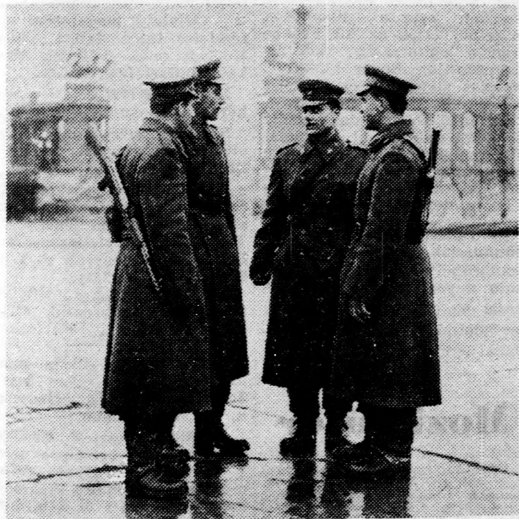
A megyéből bevonult fiatalok közül négyen. Az ország különböző részein teljesítnek szolgálatot