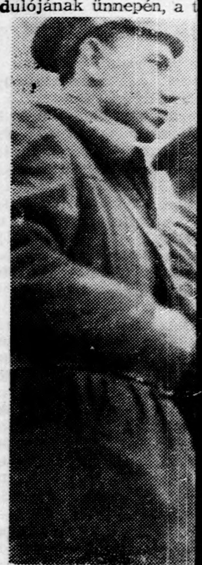
A debreceni néphadsereg alakulatainak hajdú-budapesti díszszemléjén

A városligeti tó b keményen csatáltak. A fiatal zényszakak. A fiatal „verik a vigyázz”-t. N képzés folyik. Egy kicsi annál. Hiszen a gyakorlat ha nem egyszerre har a léptek, „házon belül” kell mindenre, a leg részletekre: a lábartó fövetésre, a karmozó Hiszen néhány nap m egész ország szeme előtt legnek. Április 4-én hazánk felszabadulása dülőjének ünnepén, a t