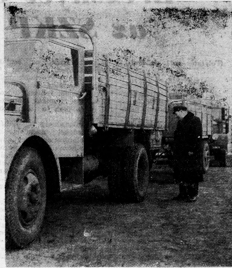
A Debreceni 6. sz. AKÖV telepein a műszak után bejövő kocsikat szakszerűen átvizsgálják műszaki és forgalmi szempontból. Képközlő: Sütő Gyula garázmester munka közben