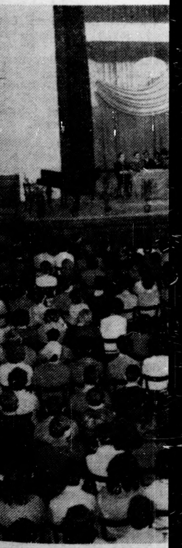
A nagygyűlés résztvevőinek

A továbbiakban arról beszélt a szónok, hogy a Demokratikus Ifjúsági Világszervezet megalakulása óta harco-