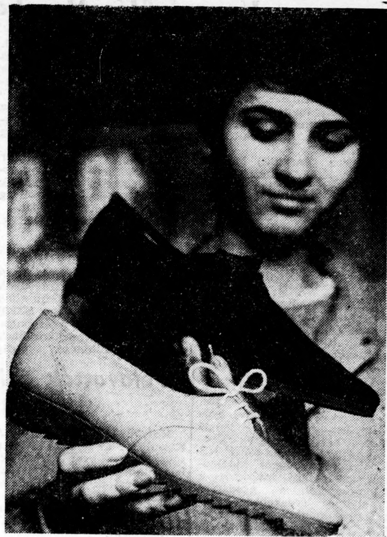
A Tisza Cipőgyár debreceni gyáregységében az elmúlt években csak gyermekcipők és szandálok készültek. Ebben az évben kezdtek meg a női és férficipők gyártását is. Az első negyedévben 80 ezer pár női cipőt adtak át kereskedelemlé. Képfőképen sötétbarna velur férfi- és női színű fűrészfogtalpú nőcipő-modell látható.

gadta a magyar parlamenti küldöttséget. A szíves és baráti légkörben lezajlott fogadáson Kállai Gyula és Alekszandar Rankovics eszmecsere-t folytatott a két országot érintő problémákról és a nemzetközi helyzet időszerű kérdéseiről. A továbbiakban a küldöttség a Száva balpartján elterülő Új-Belgrádba látogatott. Új-Belgrád megtekintése után a küldöttség részt vett azon a díszében, amelyet Mijalko Todorovics a Jugoszláv Szövetségi Nemzetgyűlés alelnöke adott a parlamenti delegáció tiszteletére. Közvetlenül a díszében után a parlamenti küldöttség a jugoszláv fővárostól 15 kilométerre levő Szurcsini repülőtérre tekintette meg. A magasrangú vendégek délután a Kalimegdan-i hadtörténeti múzeum nevezetességeivel ismerkedtek. Később este vonaton Zágrába, Horvátország fővárosába indultak. (MTI)