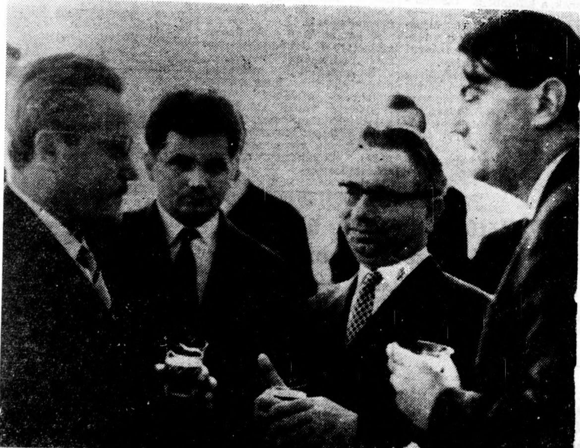
A Kállai Gyula vezetésével Jugoszláviában tartózkodó magyar parlamenti és népfőnöki küldöttség látogatást tett Edward Kardeljnél, a Jugoszláv Szövetségi Nemzetgyűlés elnökénél. Képfőképen: E. Kardelj (balról) és Kállai Gyula (jobbról) a megbeszélések után.