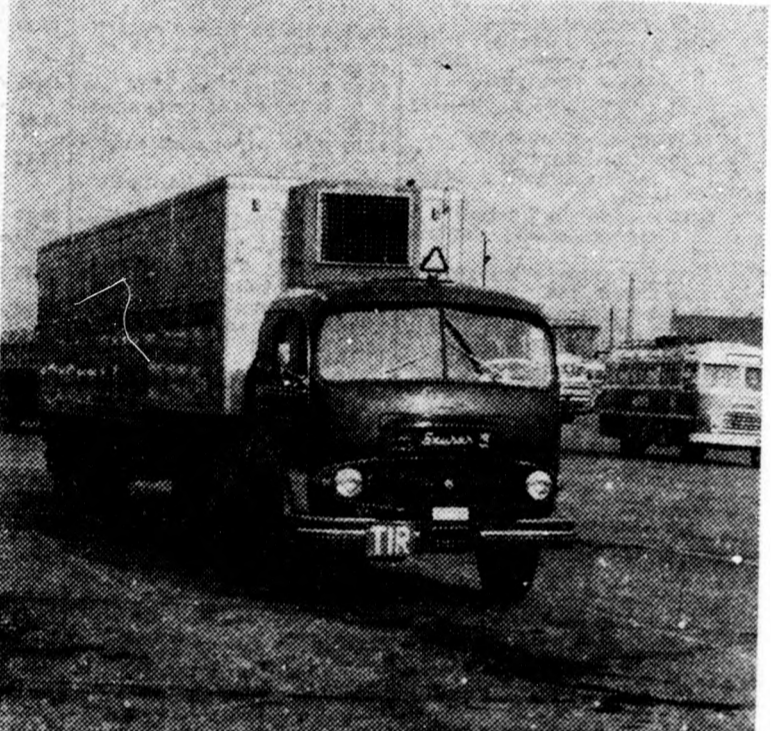
Az új 200 lóerős „termosz-autó”, amelynek belső hőmérséklete tetszés szerint —29 és +27 Celsius fok között állítható be

rab új, 20 tonnás hűtőgépkocsit állít üzembe, az 1-es számú Autóközlekedési Vállalat. Az új járműveket már bemutat-ták a vállalat telepén, s megtekintette dr. Csanádi György közlekedés- és postaügyi miniszter is.